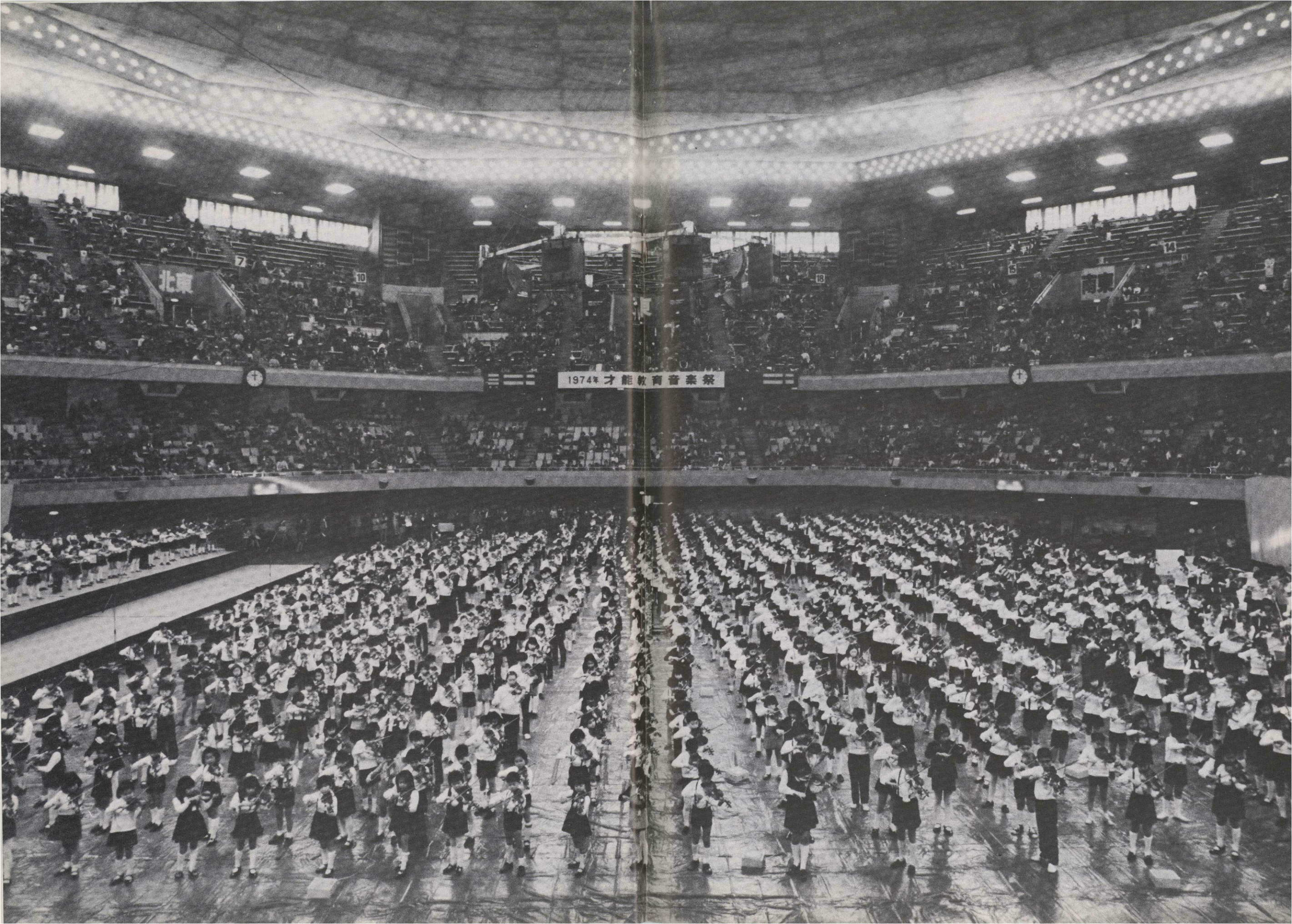
1974年才能教育音楽祭