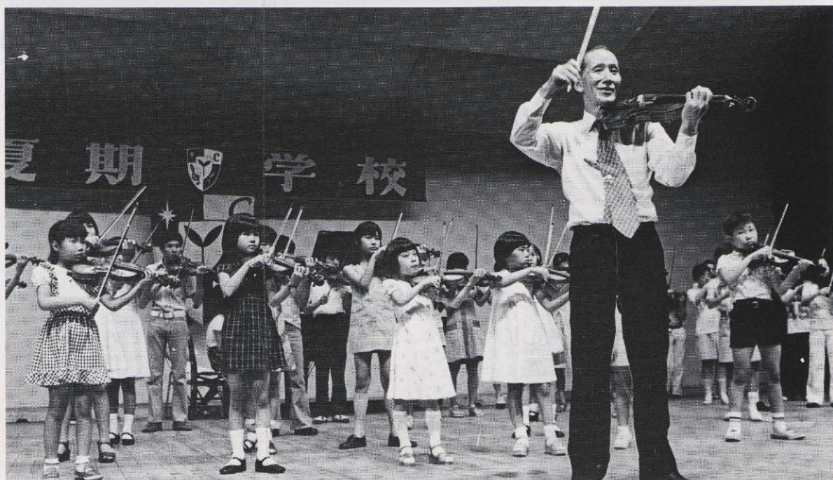
上級生のグループレッスン。リラックスと緊張のバランスがとれています。