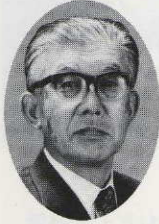
名誉会長 井深 大

才能教育関係者にとっては当り前の事になっているこの演奏会も始めて聞く人にとっては奇跡としかうづらなない感激と迫力を持っているに違いない。