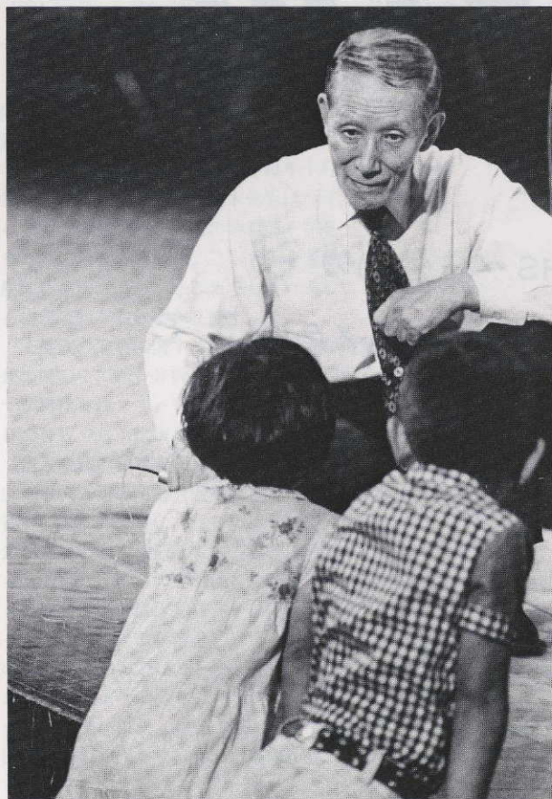
ステージの上と下での会話、どんなお話？