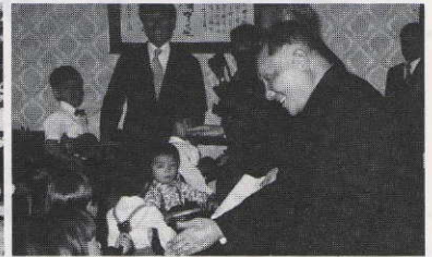
鄧小平中国副首相