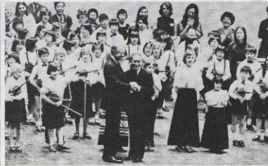
カーター前アメリカ大統領