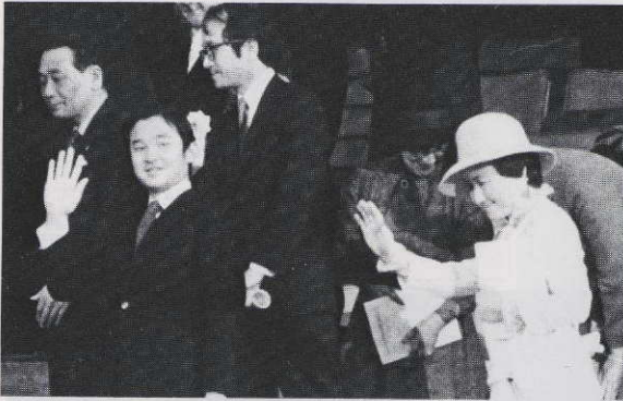
お一人でご臨席になられた浩宮さまのお見送り