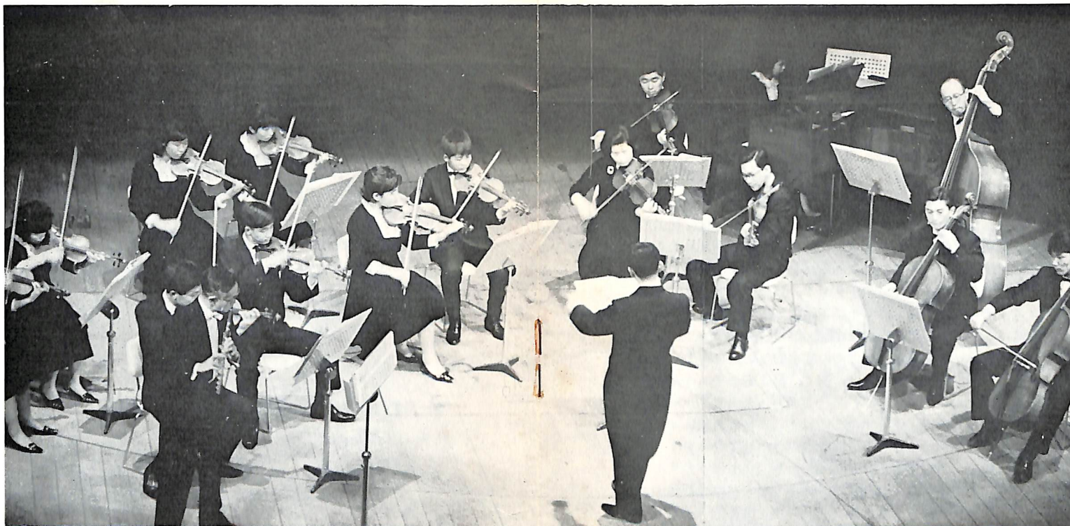
コンチェルティーノ ディ キョート (才能教育研究会京都支部合奏科Aクラス)