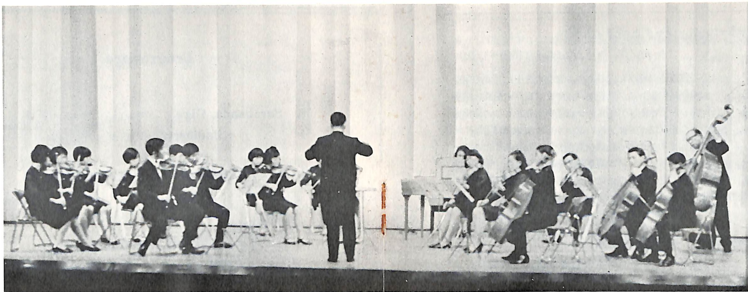
コンチェルティノー ディ キョート