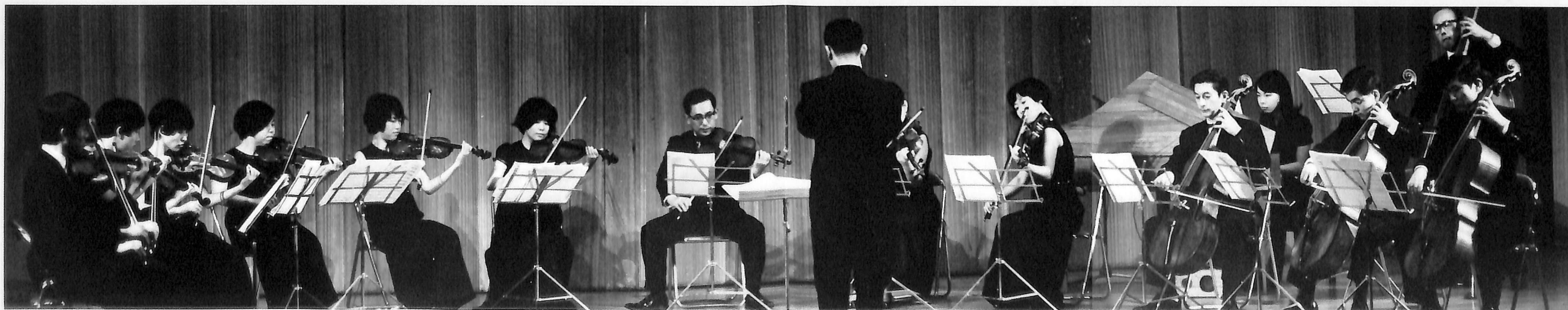
第12回コンチェルティーノ演奏会