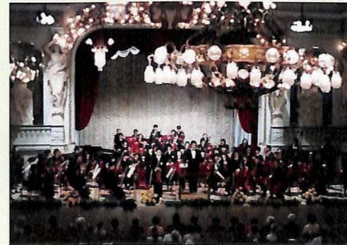
東ドイツ演奏旅行