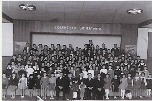
1954年 京都支部発表会