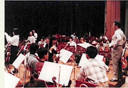
東ドイツ演奏旅行