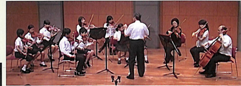
Bクラスで最後の指揮