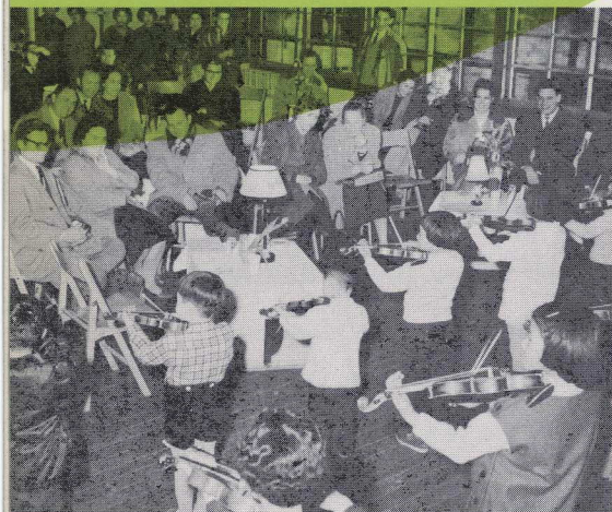
ウィーン合唱団と松本の子供達 於松本音楽院'60・2・29

Though still in an experimental stage, Talent Education has realized that all children in the world show their splendid capacities by speaking and understanding their mother language, thus displaying the original power of the human mind. Is it not probable that this mother language method holds the key to human development?