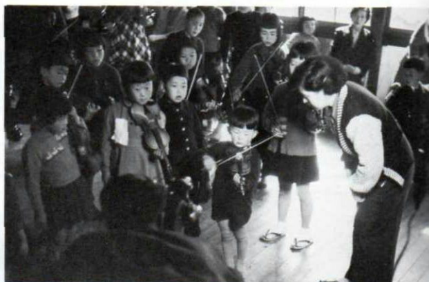
▲松本音楽院でのレッスン風景