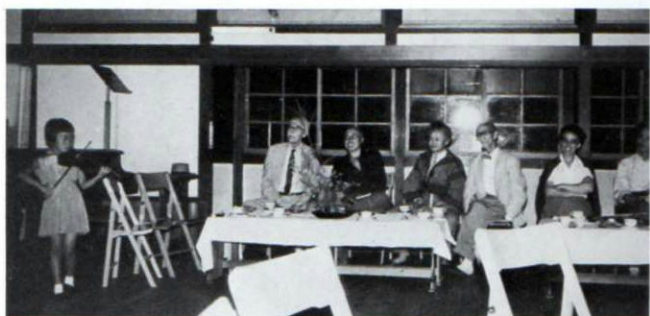
▲昭和29年8月31日 音楽院でのホームコンサート。左から、バーナード・リーチ、浜田庄司、柳宗悦、河井寛次郎の各氏