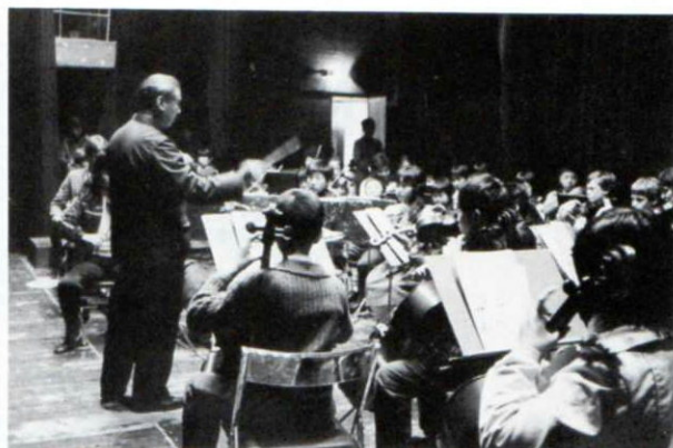
▲昭和58年3月、訪中演奏旅行(上海・西安・北京)