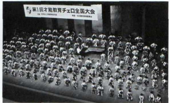
▲昭和50年、第1回チェロ大会(名古屋、愛知県文化講堂)