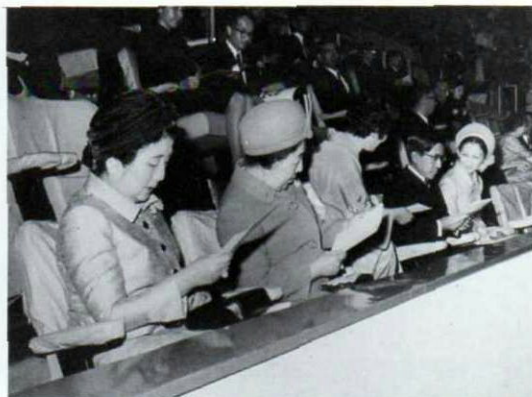
▲第18回全国大会(47年)皇后陛下、皇太子殿下、美智子妃殿下、秩父宮妃殿下