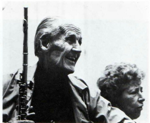
▲フルートの神様マルセル・モイズ先生を1973年10月、1977年11月に招聘、東京・松本・大阪で講習会を行い、日本中のフルート愛好者が集った。