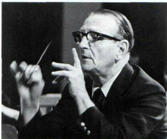
▲ピオラ界の巨匠ウィリアム・プリムローズ先生を機会ある毎にお招きして、レッスン・コンサートをご指導いただく。