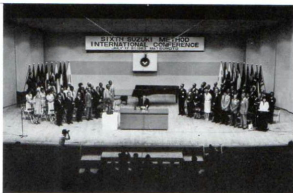
▲昭和58年7月、国際大会