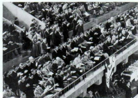
▲第1回全国大会、皇族方と各国大公使