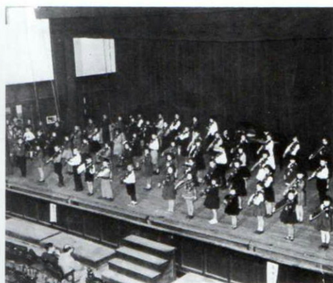
▲昭和27年10月25日、第1回卒業式(神田・共立講堂)