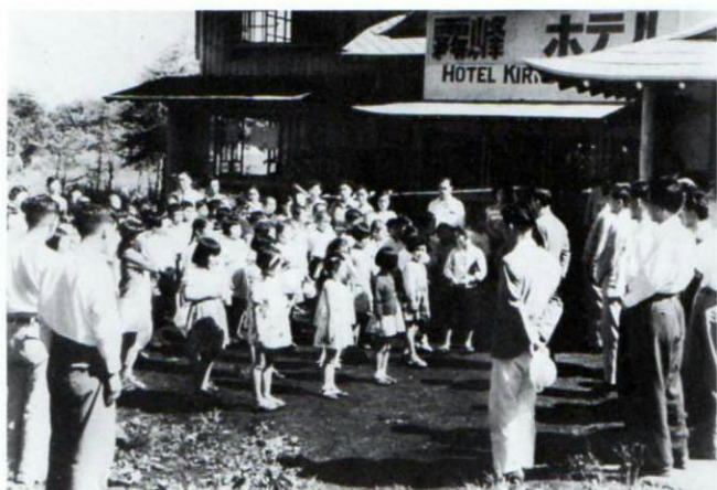
▲昭和27年、霧ヶ峰で開かれた第2回夏期学校