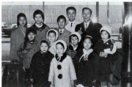
▲昭和39年3月、第1回渡米メンバー