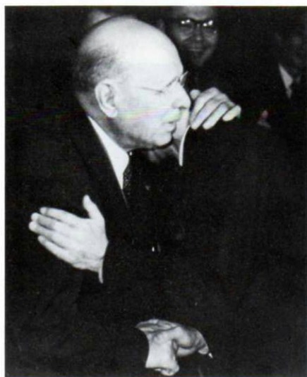
◀鈴木先生と抱き合うカザルス氏