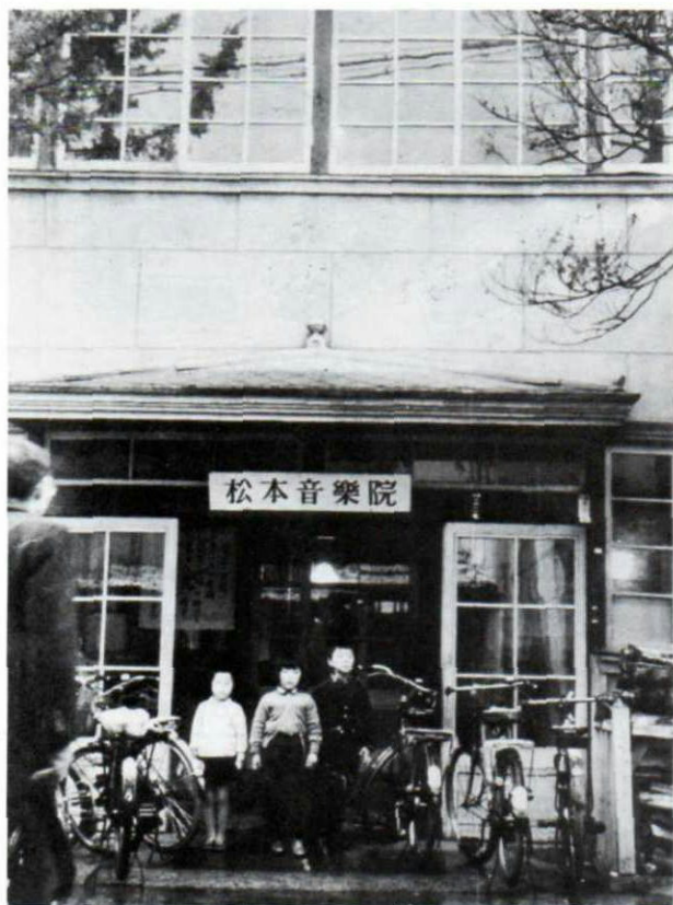
▲昭和21年に設立した松本音楽院