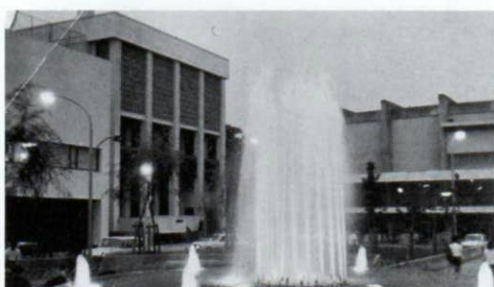
▲昭和42年7月、才能教育会館落成