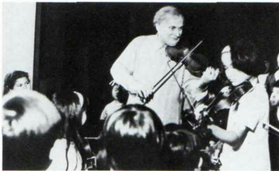
▼昭和46年、ユーディ・メニューイン氏、子供たちと合奏