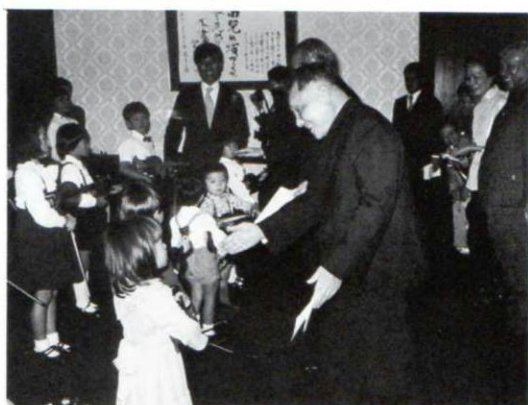
▲昭和53年10月、鄧小平、首相官邸で