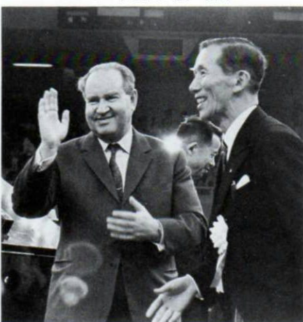
▼オISTRAFF、全国大会で指揮