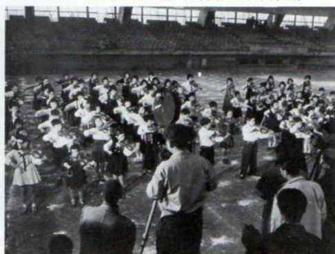
▼昭和30年3月、第1回全国大会(東京都体育館)