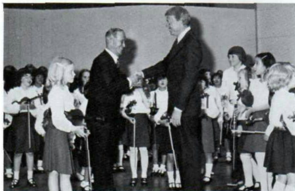
▲昭和53年4月、ワシントンで日米親善コンサート(ケネディ・センター)