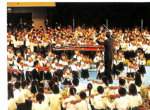
第44回スズキメソッドグランドコンサート