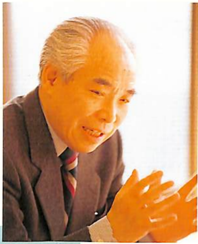
ベルリン芸術大学教授