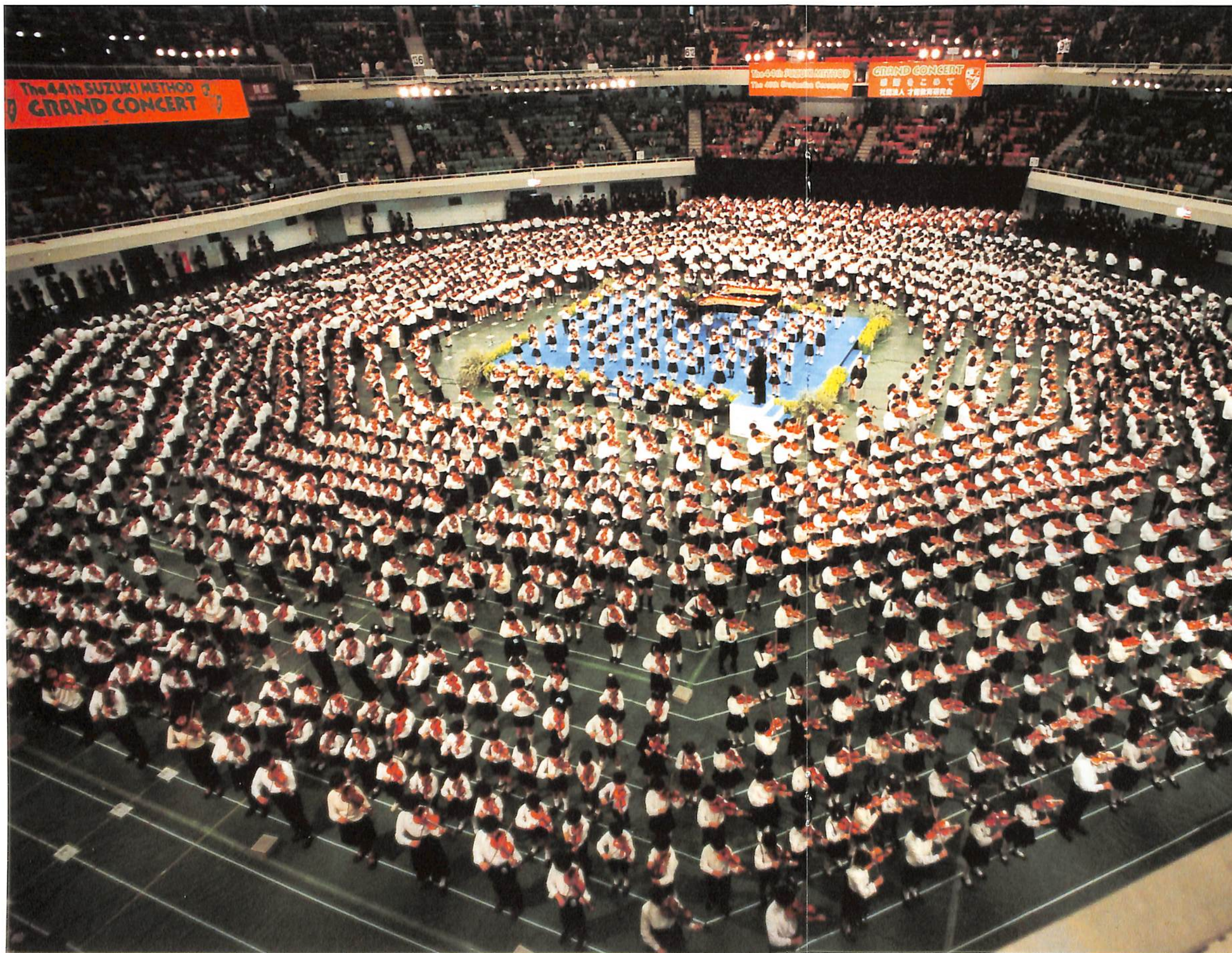
The 44th Suzuki Method Grand Concert