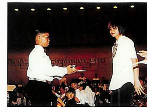
タイの子供たちに渡される寄付楽器。

「どの子も育つ、育て方ひとつ」がスズキメソッドの根本の大きな柱であれば「人は環境の子なり」も同じく、そのひとつであります。現在、残念なことです。スズキメソッドを自国の子供たちの教育へ取り入れたくても、社会的な経済基盤が弱いために、実現できない国があります。そこで、このような国々の環境づくりに、使われていない分数楽器を役立てることを、グランドコンサート出演者へ呼び掛けています。本日、この日本武道館の会場に集められました各家庭に眠っていた楽器は、国際スズキ協会の手で修理を行い、海外の国々へ送られます。再び幼い子供たちと一緒に音楽を奏することは、楽器にとっても喜びとなるでしょう。