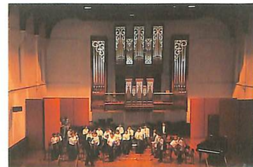
アンサンブルコンサート アデレード大学にて

この室内コンサートは、生徒に演奏する場を与えると共にグループ演奏する機会を与えるために開かれました。彼らの父兄、友人には大好評でした。