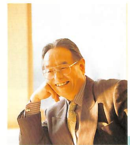
東京外国語大学学長