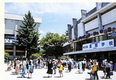
暑い日射しの中、市民会館前にぎわい