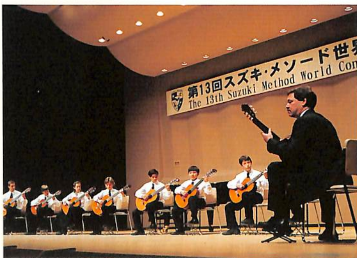
アメリカのスズキメソッドではギターも盛ん、指導はロンゲイ先生