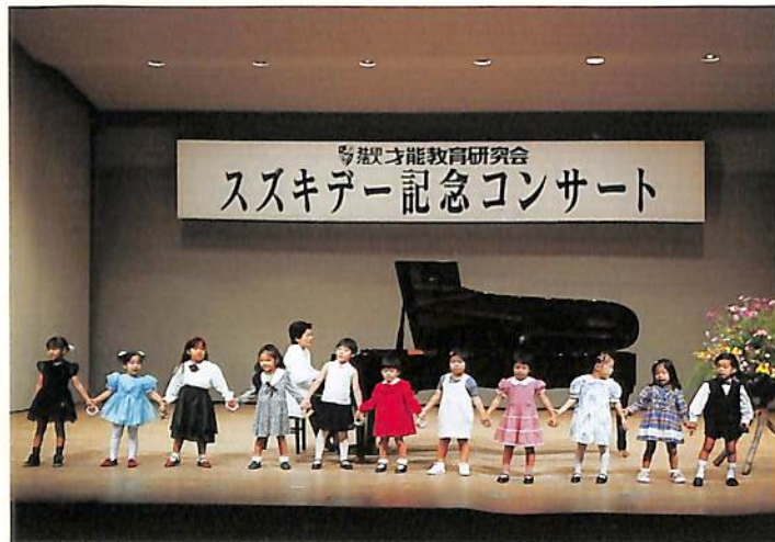
おけいこを始めたばかりの生徒によるキラキラ星リズム奏(沖縄・パレット劇場)