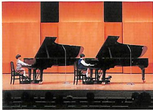
二台のピアノの音がホールいっぱい響きわたったコンサート(東京国際フォーラム)

甲信地区 10月17日 関西地区 11月7日 沖縄地区 10月23日 東海地区 11月14日 関東地区 11月7日