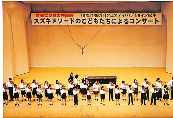
世界の人を音楽でつなぐ心の輪をモットーに開かれているこの大会、スズキの大合奏も世界へ届け