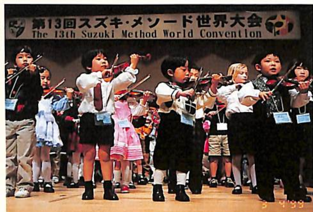
第13回スズキ・メソッド世界大会 The 13th Suzuki Method World Convention