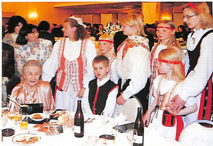
世界のスズキファミリーが集まって楽しいバンケット