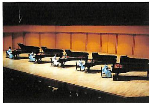
5台のピアノによるみごとな演奏(愛知芸術劇場)