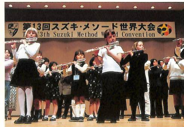
U字管はもう定番、音も姿勢もすてきになって