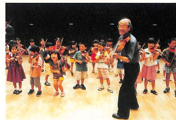
夏期学校でしか味わえない毎年恒例の大会奏 楽しい楽しいグループレッスン